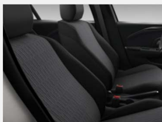
Design & Tech, Marvel Black – TAY9