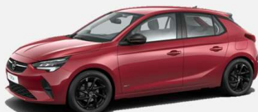
Hot Red - G1R 4 900kr