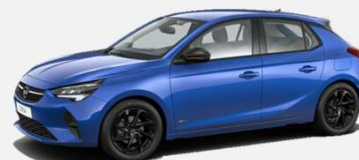
Voltaic Blue- GGI 4 900kr