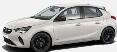
White Jade - G2o 0 kr