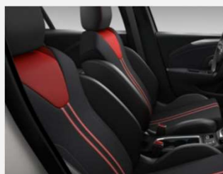
Banda, Marvel Black - TAVF