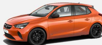
Orange Fizz- GPQ 4 900kr