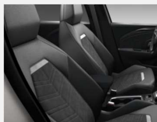
Alcantara klädsel, Jet Black- TAWT