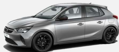
Quartz Grey - G4I 4 900kr