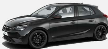
Diamond Black- G7o 4 900kr