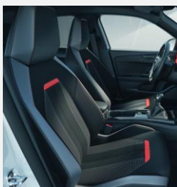
Halvläderklädsel, Focus Red - TAWF