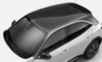
Svart tak– 22T Standard