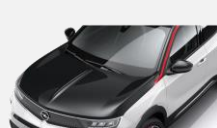
Svart motorhuv– CNP 900kr (std GS LINE ICON)