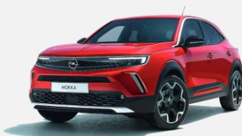
Power Red – GD6 4 900kr