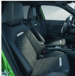
Alcantara klädsel, Jet Black- TAWJ