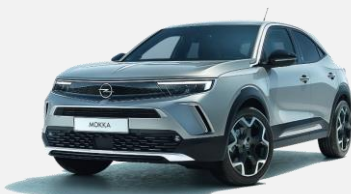
Quartz Grey – G4I 4 900kr