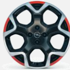
215/55 R18 Tri Color Red - CWAX