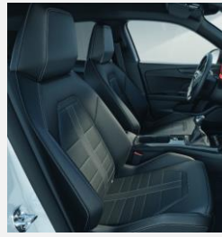
Läderklädsel, Jet black - TAWE Inkl. förarstol med svankstöd & massage