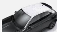
Vitt tak – 03T 2 900kr