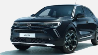
Diamond Black– G7o 4 900kr