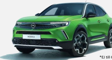
Matcha Green– GGI 0kr