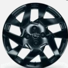
215/60 R17 Gloss black - CWA