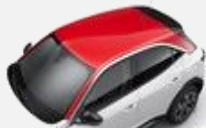
Rött tak– 34V 2 900kr