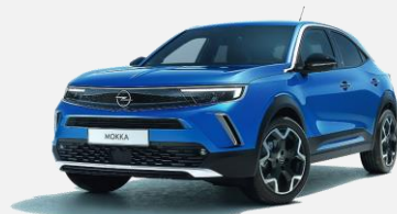
Voltaic Blue – G6L 4 900kr