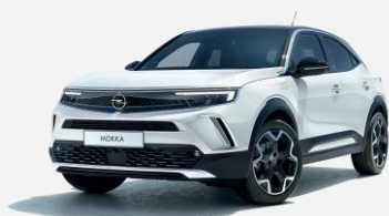
White Jade - G2o 3 900kr