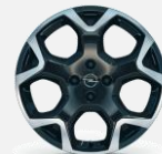
215/55 R18 Bi Color Black - CWA